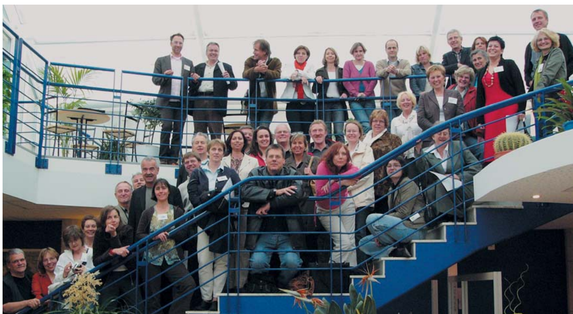
Teilnehmende der ersten Hilfeplankonferenz.

Die EP „Indigo – Integrierte Dienstleistung gemeinsam organisieren“