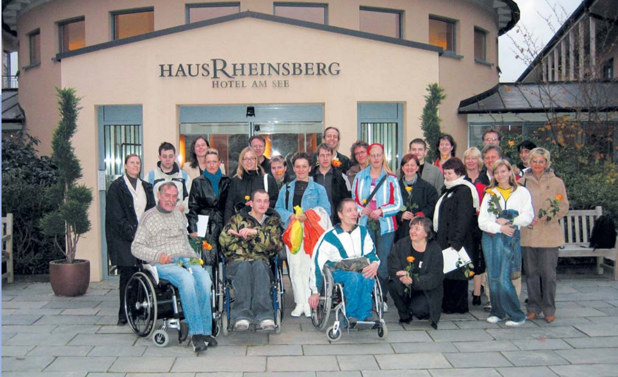
Die ersten Absolventen der EQUAL-Weiterbildungen erhielten am 30.10.2006 im barrierefreien Hotel „Haus Rheinsberg“ ihre Zertifikate als „Call-Center-Agent“ bzw. „Produktmanager mit Know-how im barrierefreien Tourismus“.