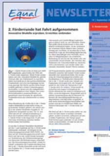
14 | September 2005 2. Förderrunde