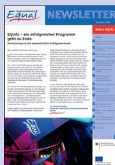
23 | April 2008 Bilanz EQUAL