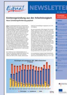
16 | Mai 2006 Gründungsunterstützung