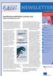
22 | September 2007 Familienfreundlichkeit rechnet sich