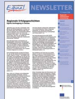
17 | August 2006 Regionale Arbeitsmarktentwicklung