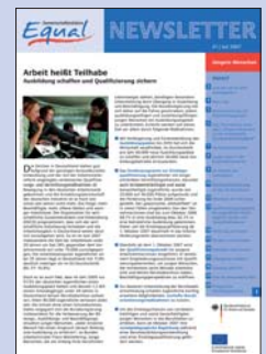
21 | Juli 2007 Jüngere Menschen