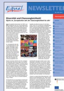
20 | Mai 2007 Chancengleichheit