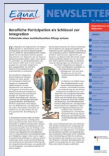
19 | Februar 2007 Migrantinnen und Migranten