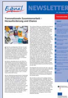
15 | Dezember 2005 Transnationalität