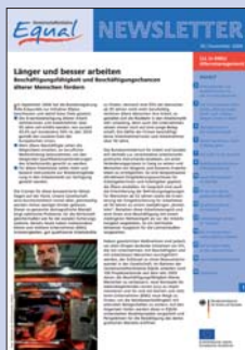
18 | November 2006 Lebenslanges Lernen in KMU / Altersmanagement