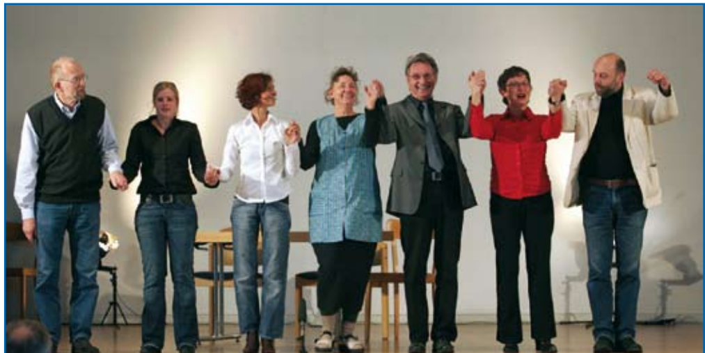
Das Unternehmenstheater aus dem EQUAL-Teilprojekt der TAT aus Rheine war ein weiteres kulturelles Angebot zum Thema. Vor allem widersprüchliche Entwicklungen in Unternehmen wurden szenisch dargestellt.