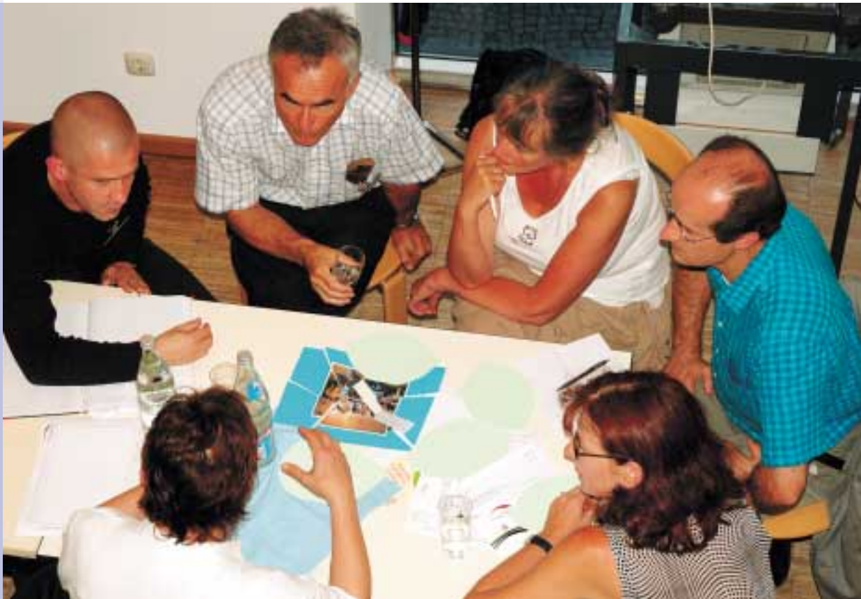
Round-Table-Gespräche helfen bei der Vernetzung regionaler Arbeitsmarktakteure.

Kolleginnen und Kollegen trifft, um sich über die Bildungszielplanung, Teilnehmerzuweisung in diverse Maßnahmen, Öffentlichkeitsarbeit und die Einbindung von Arbeitgebern auszutauschen.