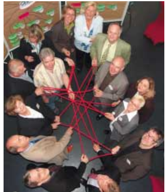
Bei QUICK ist der rote Faden das Netzwerk, so entsteht eine Gesamtstrategie für zukunftsfähiges Wirtschaften und Arbeiten mit regionalen Unternehmen und Sozialpartnern.

Viele Mitarbeiterinnen und Mitarbeiter sehen wenig Sinn darin, sich weiterzubilden. Ein Schlüssel, den QUICK einsetzt, um die Menschen für lebenslanges Lernen zu sensibilisieren, ist die „Strategische Inventur“. Beschäftigte aus allen betrieblichen Ebenen, angefangen von Unternehmens- und Abteilungs-