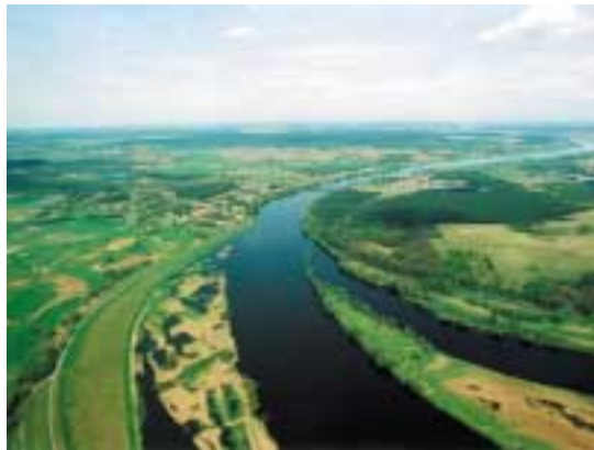
Das landschaftlich reizvolle Oderland ist auf deutscher und polnischer Seite touristisch bisher kaum erschlossen – hier liegt die wirtschaftliche Zukunftschance der Region.

In insgesamt acht Teilprojekten wird seit 2005 gemeinsam mit zahlreichen Partnern an der Befähigung der Region und ihrer Menschen gearbeitet, diese Chancen und Potenziale in wirtschaftliche Belebung umzumünzen. Am Ende des EQUAL-Projektes sollen ca. 600 Teilnehmerinnen und Teilnehmer und die gesamte Region einen großen Teil ihrer wirtschaftlichen Zukunft im Tourismus und in tourismusnahen Dienstleistungen finden können. Um diesen Zugang zum Arbeitsmarkt zu erschließen, sind jedoch neue Qualifikationen, ein gestärktes Selbstbewusstsein und eigene Ideen notwendig. Daran arbeiten die