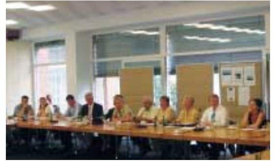
Gewinnerinnen und Gewinner des Genossenschaftspreises 2006.

Dass die Maßnahmen der innova eG erfolgreich waren, zeigen drei Preisträger des Genossenschaftspreises: Ein 3. Preis ging an die Genossenschaft Lausitzer Zeitreisen, die mit Kreativität und Selbsthilfe Ausgründungen aus zeitlich befristeten Beschäftigungsmaßnahmen (ABM, SAM) anstreben, um dauerhafte Arbeitsplätze zu schaffen. Ein 2. Preis ging an die SAGES eG Freiburg. SAGES wurde im Februar 2005 von 27 Erwerbslosen als Serviceagentur