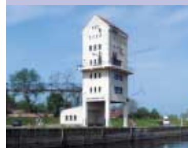
Feriedomizil der Extraklasse im ehemaligen Maschinenhaus im Hafen Groß Neuendorf – ein Best-Practice-Beispiel, das zeigt, wie Industrieruinen sinnvoll genutzt werden können.

Vor diesem Hintergrund stießen die Träger der Entwicklungspartnerschaft „Zukunft Grenzregion Oderland-NadOdrze“ auf die Gemeinschaftsinitiative EQUAL und die Möglichkeit, unmittelbar und aktiv für die Region zu