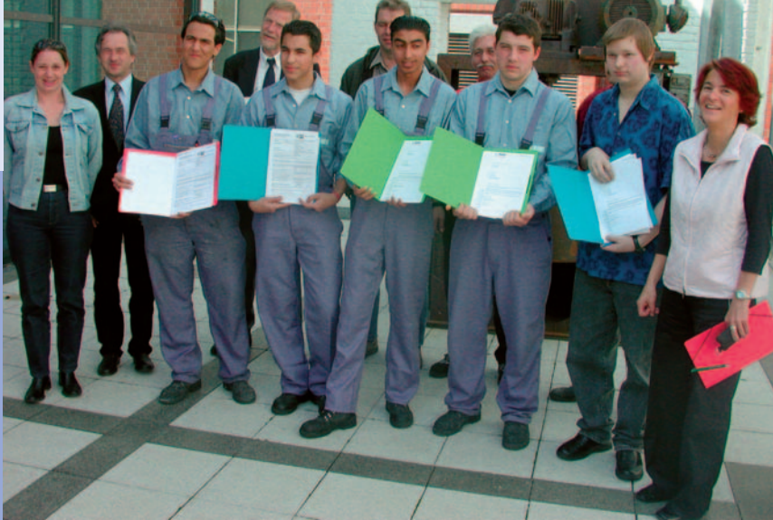
Übergabe der Ausbildungsverträge