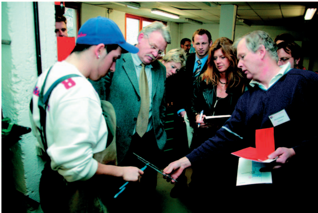
Demonstration erworbener Praxiskennnisse und Teilqualifikationen in der Jugendwerkstatt Köln-Nippes

Die Kölner Entwicklungspartnerschaft „Übergangsmanagement Schule - Beruf“ hat sich zum Ziel gesetzt, aus bisher losen Arbeitsbeziehungen einen arbeitsteiligen Verbund von Akteuren zu schaffen, die gemeinsam das Übergangsmanagement von der Schule in den Beruf verantworten. Als strategische Partner konnten die Arbeitsmarktakteure gewonnen werden. Die Träger von insgesamt 12 Teilprojekten stellen einen Mix aus öffentlichen Institutionen und Freien Trägern dar. In dieses Netz werden die in den Teilprojekten erarbeiteten Einzelprodukte eingespeist, um flächenhafte Verbreitung zu finden. Die Entwicklungspartnerschaft, die vom Schulamt der Stadt Köln koordiniert wird, ist daher sowohl Innovationspool als auch Transferagentur für Innovation.