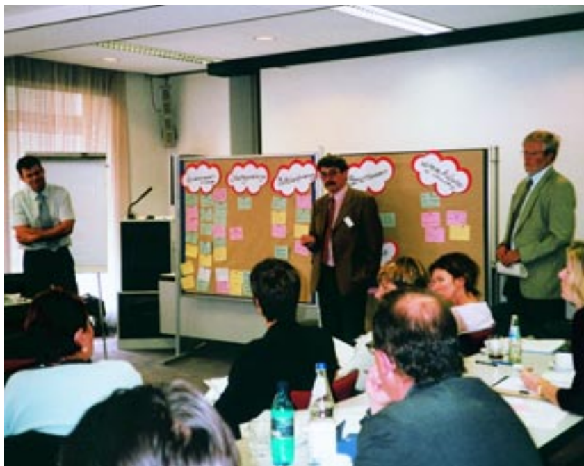
Workshop der Mittelverwaltenden Stellen im Bundesministerium für Arbeit und Sozialordnung

Das Pflichtenheft definiert kein Rechtsverhältnis zwischen dem BMA und den mittelverwaltenden Stellen, da beide keine Rechtsbeziehung miteinander eingegangen sind. Auftraggeber für die mittelverwaltenden Stellen sind vielmehr die Zuwendungsempfänger der Entwicklungspartnerschaften. Das Pflichtenheft hat damit den Status einer Arbeitsan-