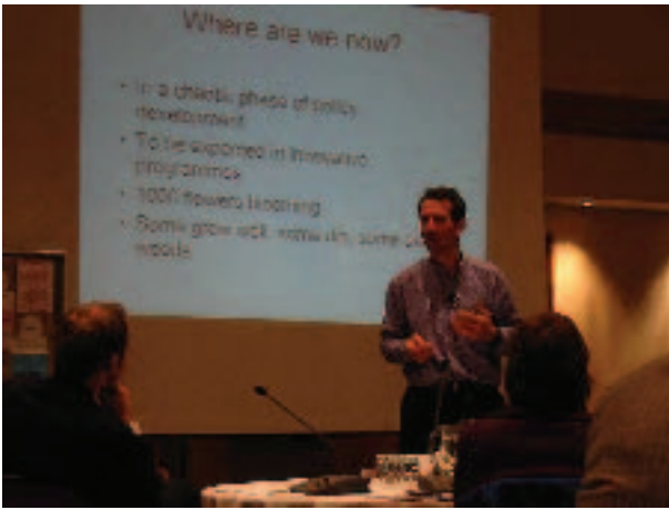
Information und Diskussion im Plenum der ETG Entrepreneurship

und 6. Juni 2003 in London stattfinden wird. Zu den Teilnehmer/innen werden auch Vertreter/innen von Best-Practice-Projekten und EQUAL-Entwicklungspartnerschaften eingeladen. Ein Workshop mit dem Schwerpunkt Sozialwirtschaft wird im September 2003 folgen.