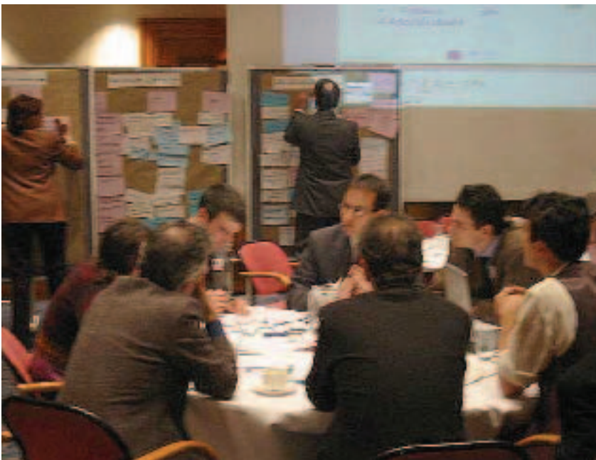
ETG Entrepreneurship-intensives Arbeiten in Kleingruppen

Die Nominierung der Entwicklungspartnerschaften erfolgt entsprechend der Themen, die sich die ETG für die Arbeitsschwerpunkte pro Jahr gesetzt hat. Bis Ende April diesen Jahres soll eine erste Auswahl feststehen. Ein weiteres Treffen ist für den Mai 2003 geplant.