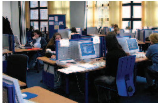
Computer Fitness Center der EP Equal-IT-y in the information society in Frankfurt a.M.

Im Oktober 2002 öffnete das Computer Fitness Center in Frankfurt a.M. seine Tore. Initiiert von der Entwicklungspartnerschaft "Equal-IT-y in the information society" und gefördert vom Arbeitsamt Frankfurt a.M., erhalten Mädchen und Frauen hier die Möglichkeit, individuell und bedarfsbezogen am Computer zu lernen und zum Beispiel erste Erfahrung im Internet, am PC und bei der Website-Gestaltung zu sammeln. Vergleichbar einem Workout im Fitness Center, können Frauen entsprechend ihrer Ausgangslage sowie ihrer Lern-, Leistungs- und Lebensbedürfnisse Computerkenntnisse trainieren und die European Computer Driver's Licence (ECDL) erwerben. Dafür stehen 30 PC-Arbeitsplätze zur Verfügung.