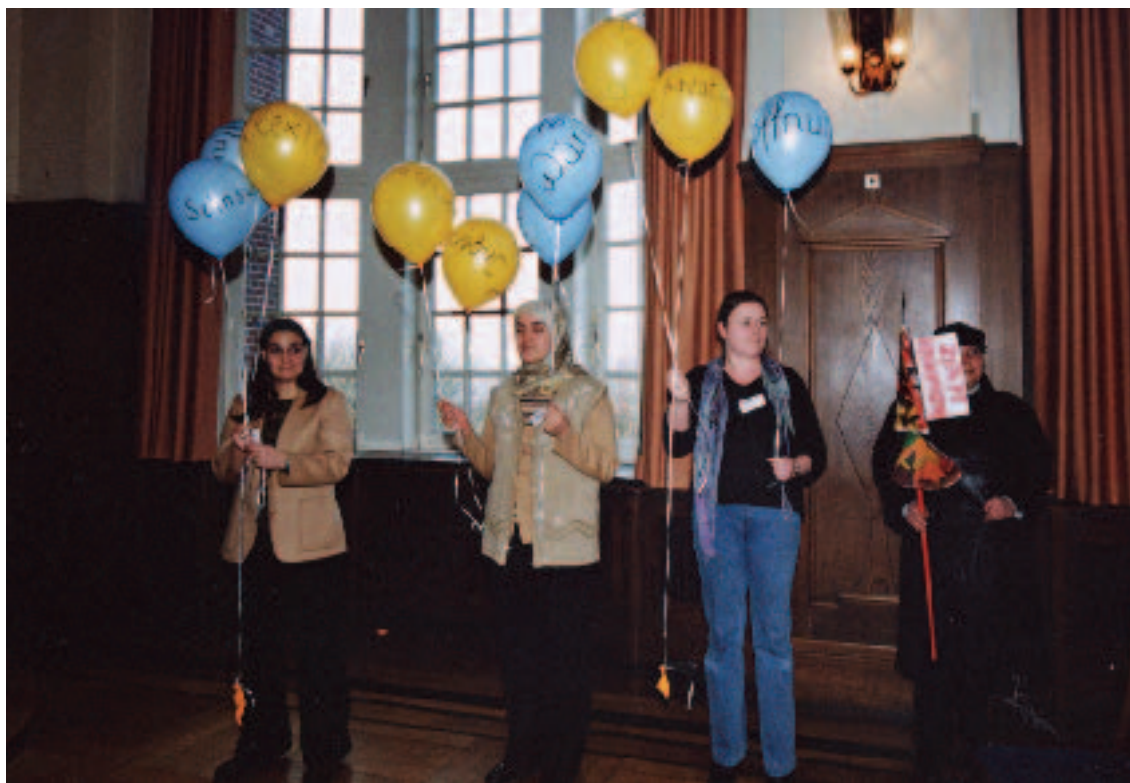
Wünsche und Träume: Präsentation auf der Börse für Ausbildungs- und Arbeitsplätze in Hamburg

Mit dem Satz eines Betriebsvertreters “Die Wirtschaft schaut nicht auf Papiere, sondern darauf, was die Leute können...”, ist ein hoffnungsvolles Signal gesetzt, weitere strategische Partner aus der Wirtschaft zu gewinnen und damit weitere Nischen auszubauen, um Plätze für Ausbildung und Qualifizierung zu finden.