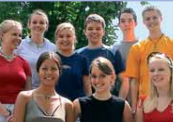
Der Kreativitäts- und Innovationspreis ging an das deutsche Team