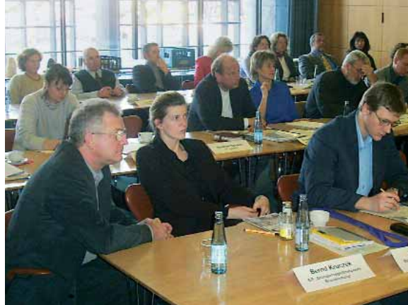
Treffen des nationalen thematischen Netzwerkes Gründungsunterstützung am 26.-27.02.2003 in Mainz