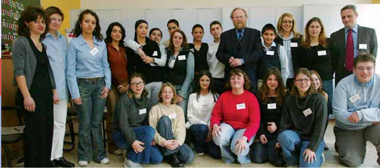
Bundestagspräsident Wolfgang Thierse diskutierte mit ausländischen Jugendlichen über Ausbildungsfragen

Gefördert durch das Bundesministerium für Wirtschaft und Arbeit aus Mitteln des Europäischen Sozialfonds