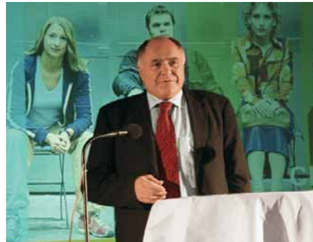
Staatssekretär Rezzo Schlauch eröffnete am 01. Juli 2003 den Berliner Gründerwettbewerb

Die Träger der unter Schirmherrschaft von Bundestagspräsident Wolfgang Thierse stehenden Entwicklungspartnerschaft sind der JugendLOK e.V. (Enterprise Berlin) und die IQ Gesellschaft für innovative Qualifizierung e.V. (Enterprise Brandenburg). Sie unterstützen seit 1999 junge Erwachsene beim Aufbau ihrer (Kleinst-)Unternehmen. Neben Brandenburg und Berlin sind in den Bundesländern Sachsen und Mecklenburg-Vorpommern Enterprise-Referenzzentren etabliert. Weitere Referenzzentren in Sachsen-Anhalt, Thüringen, Nordrhein-Westfalen und anderswo sollen jetzt folgen. In Berlin wurde seit dem Start von EQUAL die Anzahl der Beratungsbüros (One-Stop-Shops) auf fünf erhöht. Enterprise arbeitet in den One-Stop-Shops mit anderen Einrichtungen der Jugend- und Arbeitsmarktpolitik räumlich und inhaltlich eng zusammen. Bisher nahmen bundesweit 2.150 junge Erwachsene Enterprise-Förderangebote an und es wurden 300 Gründerinnen und Gründer mit einem Durchschnittsalter von 25 Jahren beim erfolgreichen