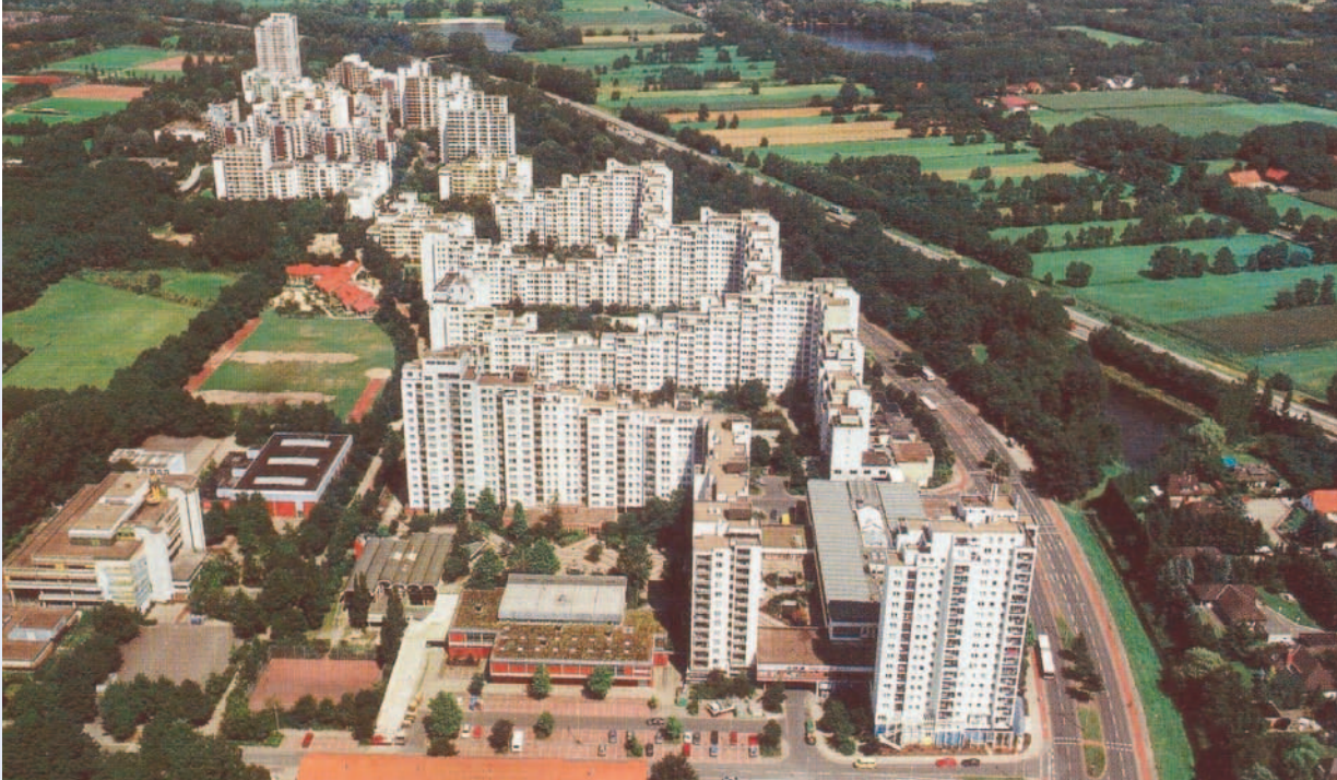
Stadtteil Tenever in Bremen